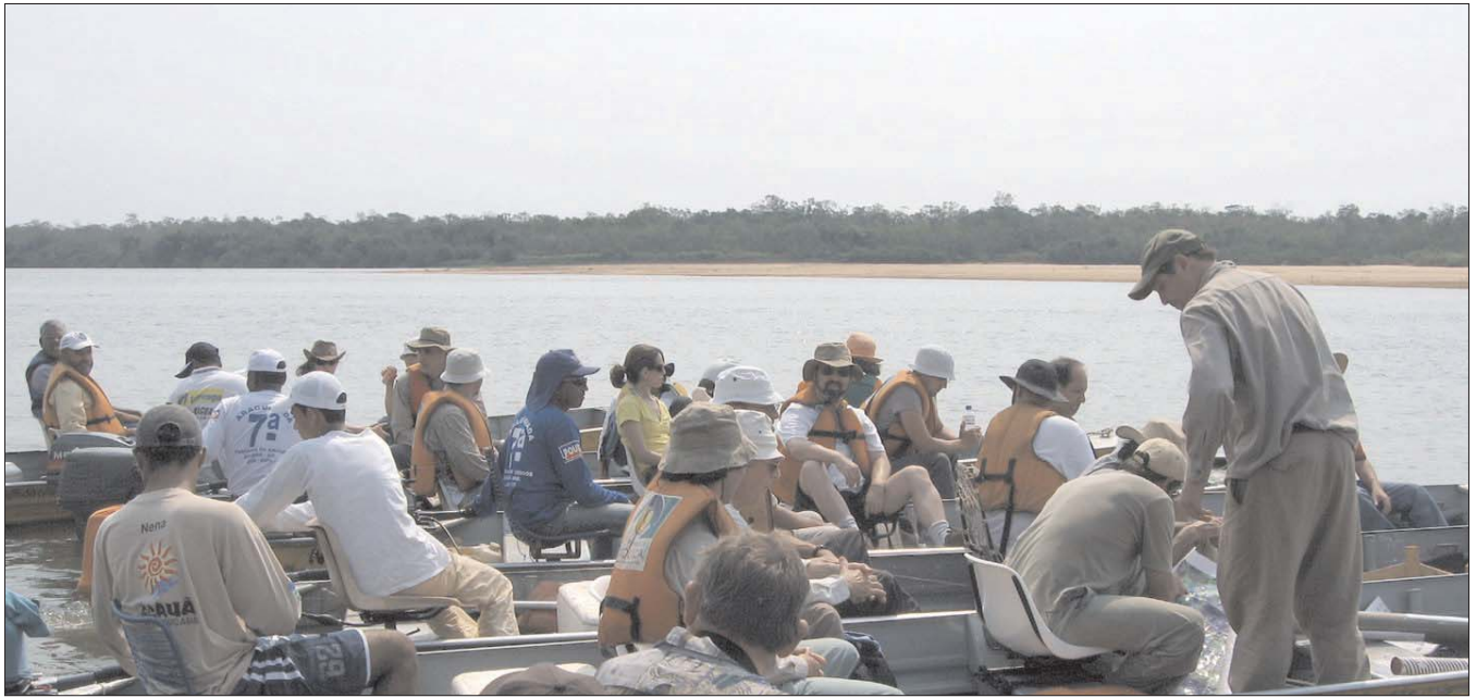
Schwimmender Exkursionsstopp auf dem Araguaia Fluss

unterschätzender Vorteil angesichts der schier Masse an beinahe ausnahmslos portugiesisch sprechenden Kollegen und brasilianischen Studenten.